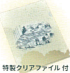
特製クリアファイル付

羽黒山の開祖蜂子皇子は鶴岡市由良の八乙女浦に上陸し、在地の民に食べ物をお恵んで頂き、三本足の八咫鳥に導かれ、羽黒山にたどり着いた。修行の後、天皇に本尊を祀る社の建立を願い出て許され、鳥に因んで羽黒山寂光寺と宣下された。