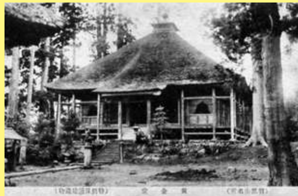
【正善院黄金堂】明治41年特別保護建造物に指定。昭和4年国宝建造物、昭和25年重要文化材建造物に指定された。