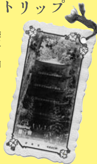
【出羽三山しおり(昭和初期)】