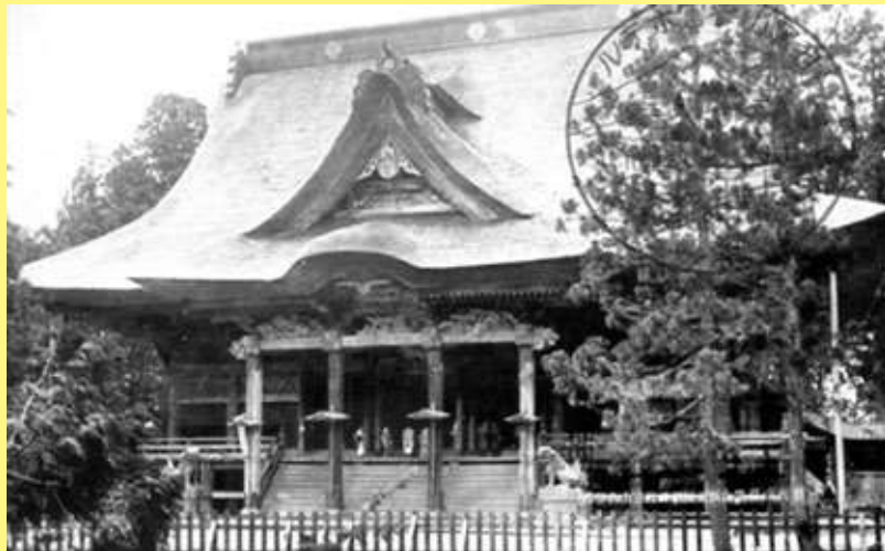
【御本社(三神合祭殿)】権現造り(どんげんづく)りの屋根。 御本社が現在のように塗り替えられたのは、昭和45年～47年。(写真は昭和10年代)

いにしえより多くの人々が全国から参拝に訪れ繁栄してきた信仰の山・出羽三山。貴重な画像や写真から往古の出羽三山の姿・賑わいを感じてください。