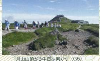
月山山頂から牛首へ向かう (G5)