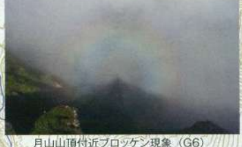
月山山頂付近ブロッケン現象 (G6)