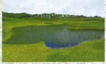
弥陀ヶ原湿原遊歩道 (B~C5)

月山登山にあたっては、ルールを守り安全に登ることを心がけましょう。そして、美しい月山の大自然の魅力を満喫しましょう。