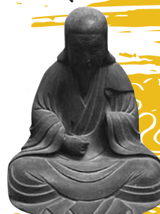
「鉄門上人 木像」 (海向寺蔵)