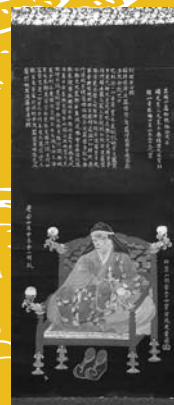
「開山御尊像 逆般若心経」 (個人蔵)