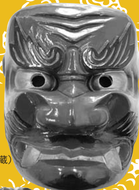
「鬼剣舞面」 (北上市立鬼の館蔵)