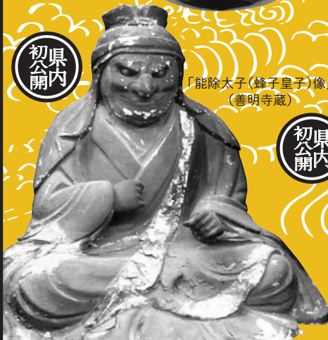
「能除太子(蜂子皇子)像」 (善明寺蔵)