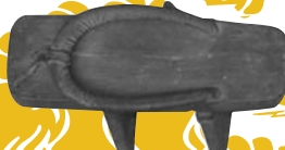
「天狗の遺物(2点)」下駄・湯飲茶碗 (遠野市立博物館蔵)