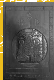
「湯殿山御澤佛名号曼荼羅(版木)」 (海向寺蔵)