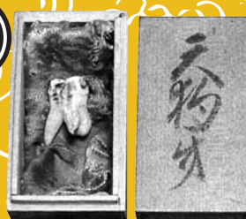
「天狗の牙」(善明寺蔵)