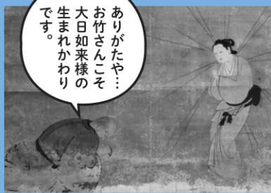
「於竹大日如来図 （於竹大日如来と玄良坊）」部分 玄良坊蔵