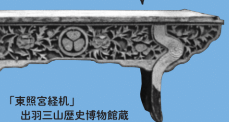
「東照宮経机」 出羽三山歴史博物館蔵