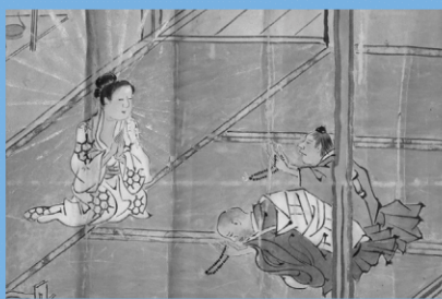
「於竹大日如来縁起」部分 正善院蔵