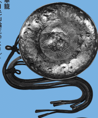
「華籠 （日光山輪王寺より）」 正善院蔵

これからの霊山は 女性にもやさしく なくっちゃ！ 女性のための参詣 システム色々。