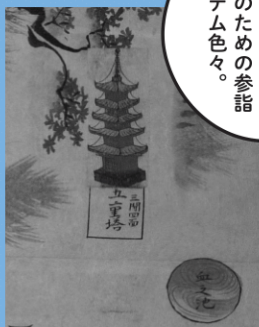
「三山總絵図」部分 出羽三山歴史博物館蔵