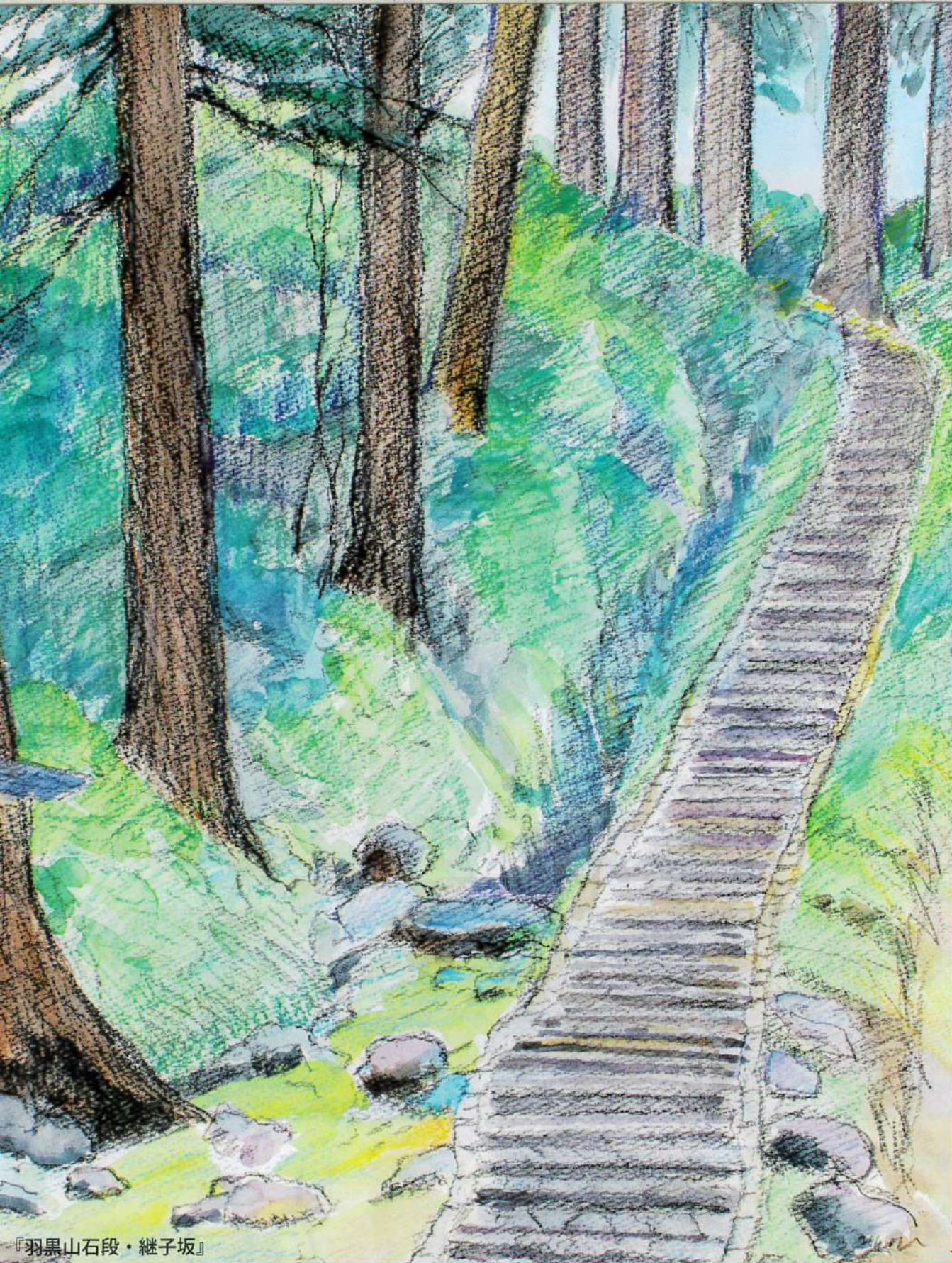
『羽黒山石段・継子坂』