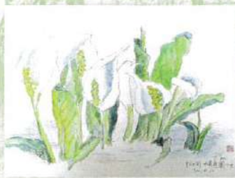
「松ヶ岡 水芭蕉園にて」