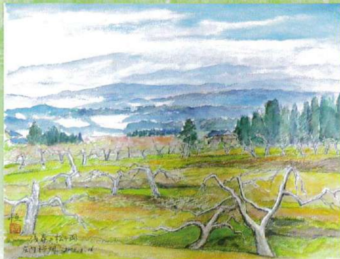
「庄内柿畑」(松ヶ岡開墾場から)

1930(昭和5)年 東京都大井町に生まれる。 1935(昭和10)年 父親の転勤のため広島へ移住。 1945(昭和20)年 8月6日 中学2年の時に被爆。両親の郷里・鶴岡へ帰郷。 1949(昭和24)年 鶴岡第一高等学校卒業、庄内銀行へ就職。以後数々の作品を受賞。 1992(平成4)年 退職を機に作品制作に専念。 松ヶ岡開墾場内「ギャラリーまつ」や致道博物館で複数回個展、他県内外多数展示開催。 画集『出羽路の茅葺き民家』、『庄内の憧憬』を刊行。 羽黒町教育文科功勞表彰、朝日村サプライズ表彰、鶴岡市芸術文化協会功勞表彰。