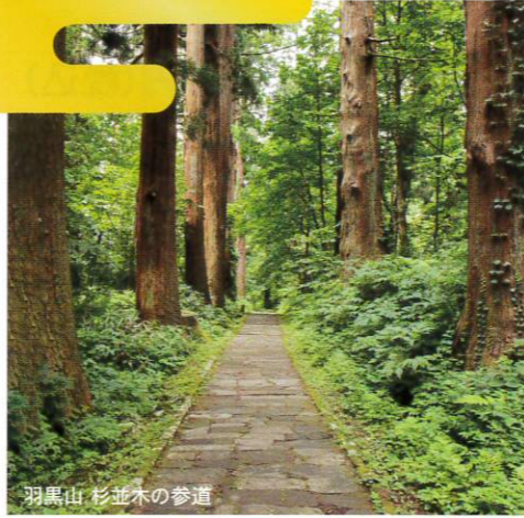
羽黒山 杉並木の参道