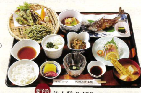
要予約 仙人膳 2,420円(税込)

お食事 季節の山菜やきのこなど旬の食材を使用した、自然の恵みを味わう精進料理です。